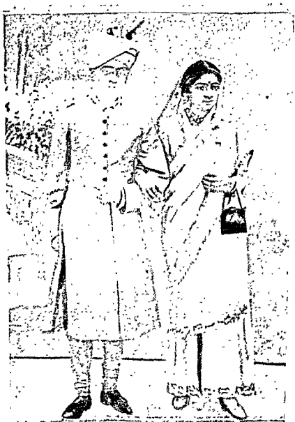
Husband and wife.